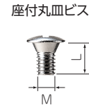
ヘッド形状(ピンあり)