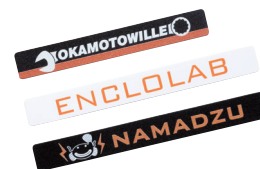
銘板ステッカー NKSTシリーズ P7