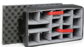
ディバイダー DVIシリーズ P4