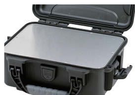
アルミパネル NKAPシリーズ P3