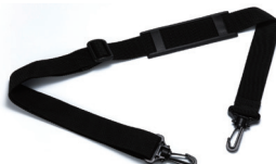
ショルダーベルト SB1250 P6