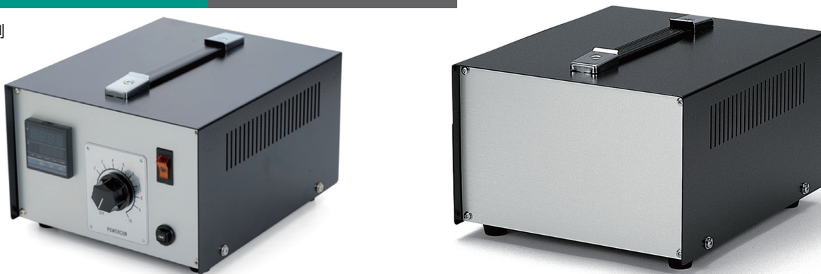
製品使用例 温度コントローラー