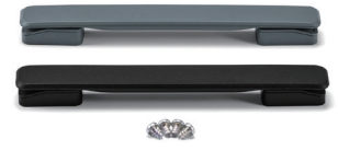
エラストマ取手 FM200シリーズ P14-19