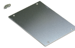
シャーシ UCCシリーズ P8-15~16